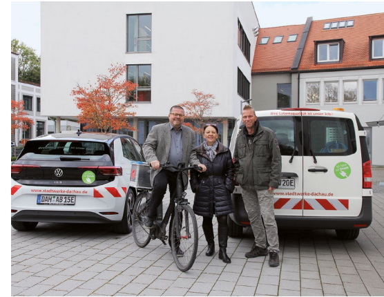
Immer mehr Stadtwerke-Mitarbeiter nutzen Elektroautos oder E-Bikes für ihre Dienstreisen.

Austausch alter Transformatoren durch moderne, verlustärmere Trafomodelle wurde bereits initiiert. Ein Trafo wird eingesetzt, um elektrische Energie aus einem Stromnetz höherer Spannung in ein Stromnetz niedriger Spannung einzuspeisen.